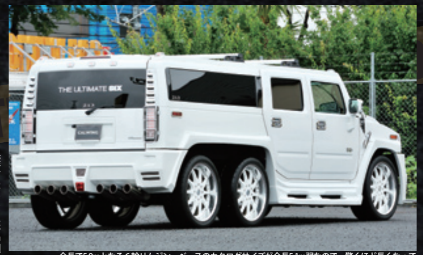
全長で5.9mとなる6輪リムジン。ベースのカタログサイズが全長5.1m弱なので、驚くほど長くなっているわけではない。とはいえ、見た目はサイズ以上に大きく感じてしまう。6輪すべてにブレーキを装備し安全面も高い。ちなみにこの車両は個人が所有。何ともうらやましい限りである。