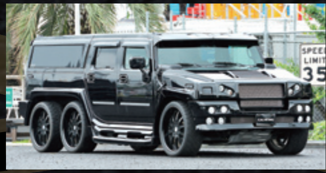
ブラックの6輪H2リムジンは、イベントなどで貸し出されるレンタル用。現在は内装を改装中だ。フロントは213オリジナルのラグジュアリーフェイスキット、リアはゼノン。フロントバイザーやリアウイングも装着される。ホイールはホワイトと同様に、ハイパーフォージド・HF213Rの24インチで、ブラックヘイントが施される。