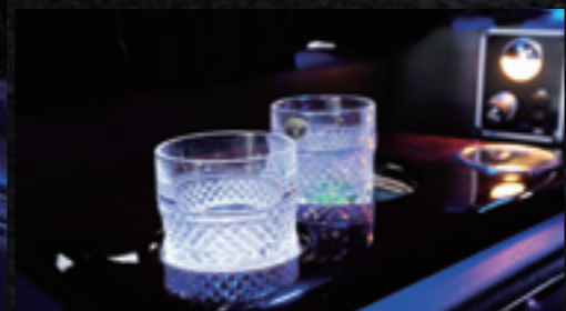
インテリアの注目はやはり後部座席。全長がストレッチして室内をリムジン化。ルーフなどをブラックレザーで統一し、ブルーの間接照明で照らされる車内は、何とも妖艶だ。