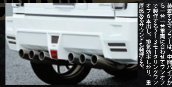
装着するマフラーは、中間ハイブから一台一台車両に合わせてワンオフで製作する213モーターリングワンオフ6本出し。排気効率しかり、重厚感あるサウンドも楽しめる。