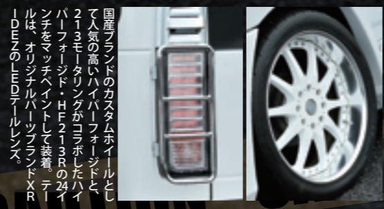
国産ブランドのカスタムホイールとして人気の高いハイパーフォージドと、213モーターリングがコロボしたハイパーフォージド・HF213Rの24インチをマッチヘイントして装着。テールは、オリジナルパーツブランドXR-IDEZのLEDテールレンズ。